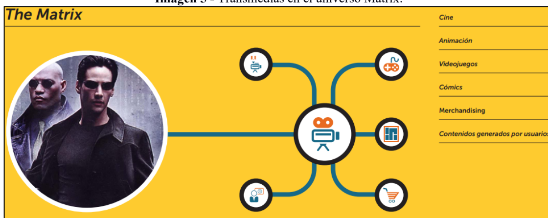
Imagen 5 - Transmedias en el universo Matrix.