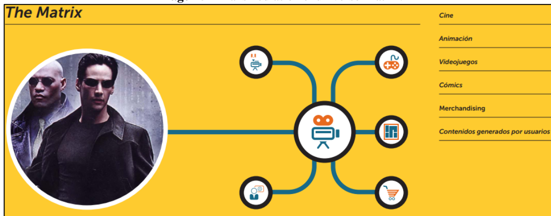
Imagen 5 - Transmedias en el universo Matrix.