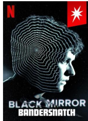
Imagen 1- Portada de la película 5 .

Imágenes 2 y 3 - acciones cotidianas para decidir y esas van a llegar a tu final con base en las cosas que elegiste.